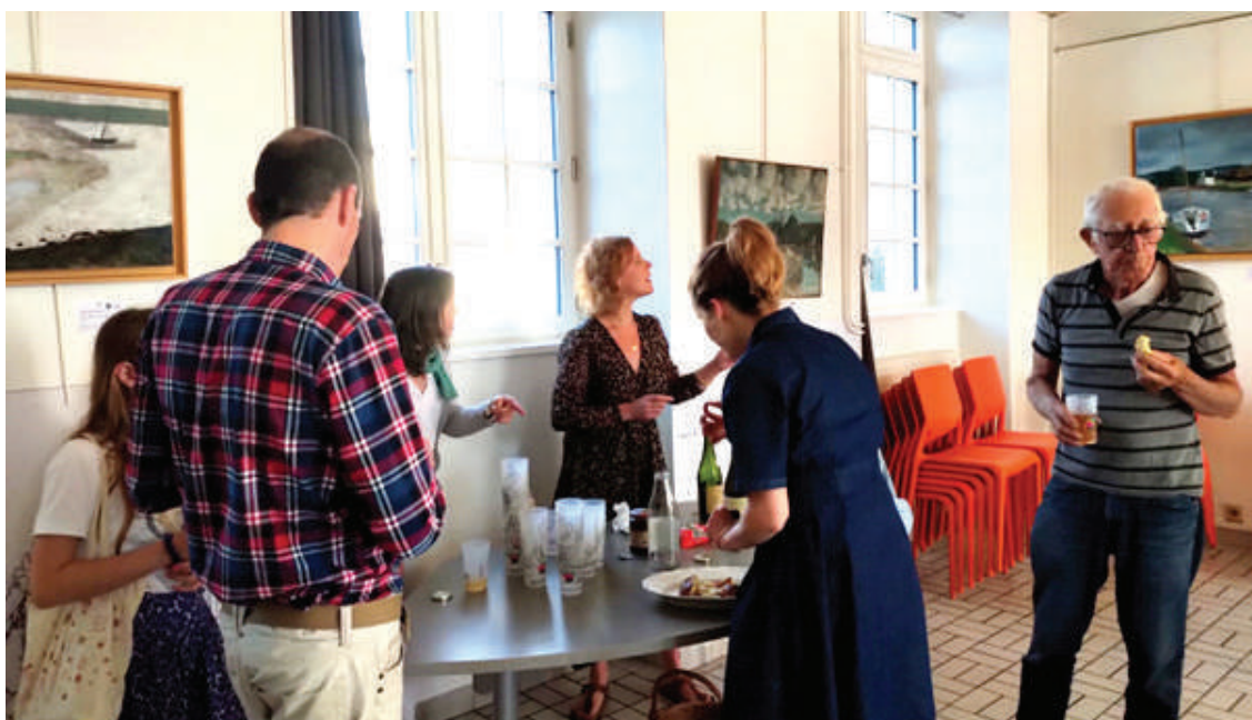
La restitution publique a été accompagnée par la dégustation de pasteo. 25.05.2023

Pour ce faire, une restitution publique a été organisée le 25 mai 2023. L'objectif était de rendre compte du projet et de nourrir le bilan et les préconisations avec ces échanges.