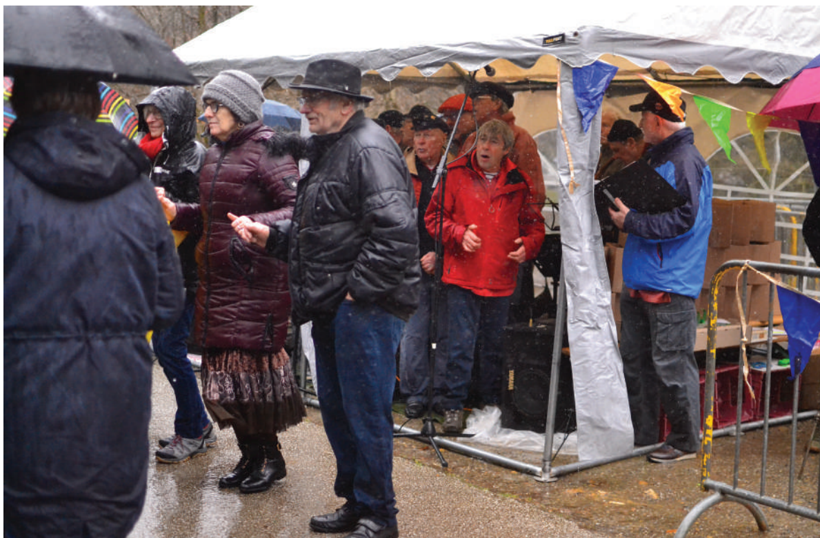
Fest-deiz spontané à la fête des Jonquilles, avec le Groupe À virer au chant. 12.03.2023.