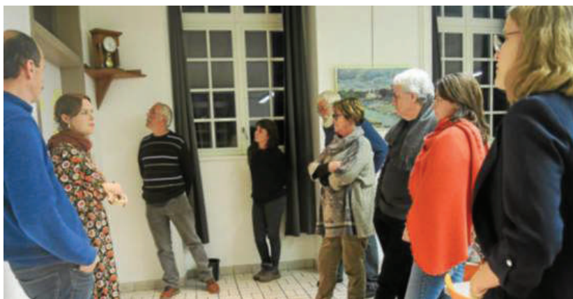
Une liste (non exhaustive) a été dressée et classée par grands axes.

Deux nouvelles rencontres sont prévues sur le marché les samedis 19 et 26 novembre, à partir de 9 h, pour peaufiner la collecte d'informations.