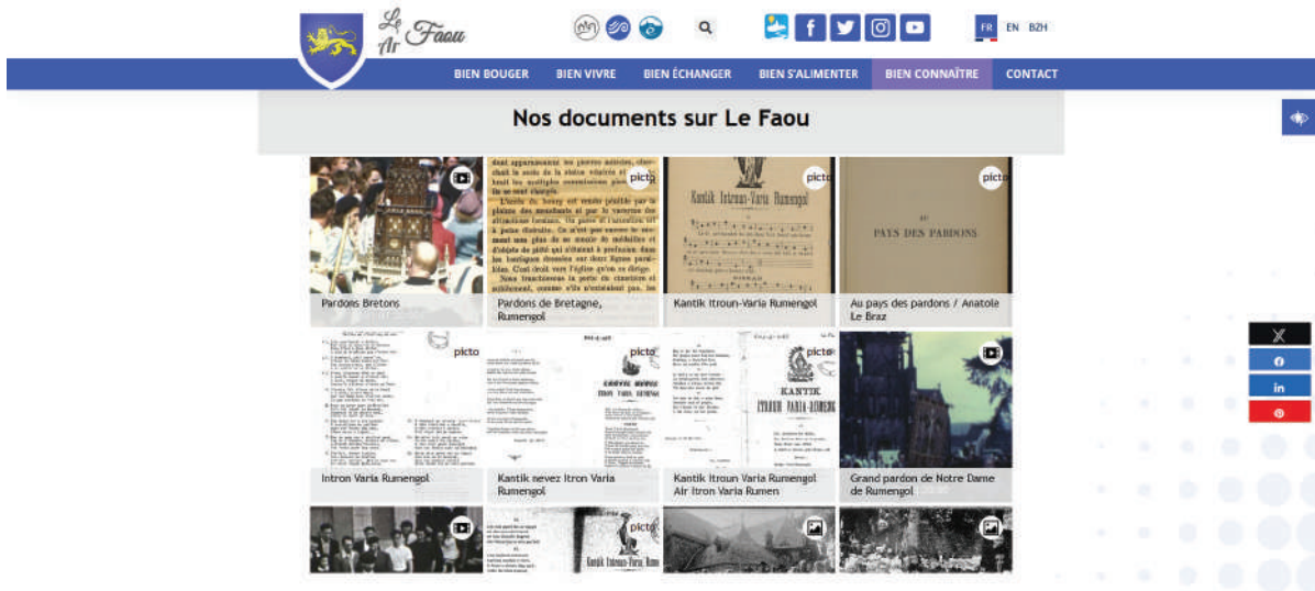
Capture d'écran du widget Bretania intégré sur le site Internet de la commune.

Une page du site Internet de la commune a été dédiée au patrimoine vivant, intégrée à la section « Bien connaître ». Ce contenu froid comprend le visuel présentant le patrimoine vivant identifié sur la commune, ainsi qu'un widget. Une galerie de documents issus de Bretania a donc été ouverte. Nous avons regroupé tous les documents concernant Le Faou et Rumengol, avec une sélection thématique sur les archives du patrimoine vivant identifié sur la commune : on y retrouve des films anciens sur les pardons de Rumengol, des partitions du cantique Itron Varia Rumengol , des chansons ou conversations en breton, etc.