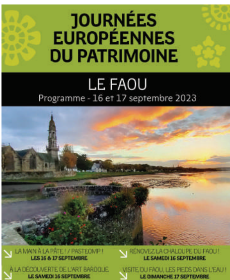
Affiche pour annoncer les JEP