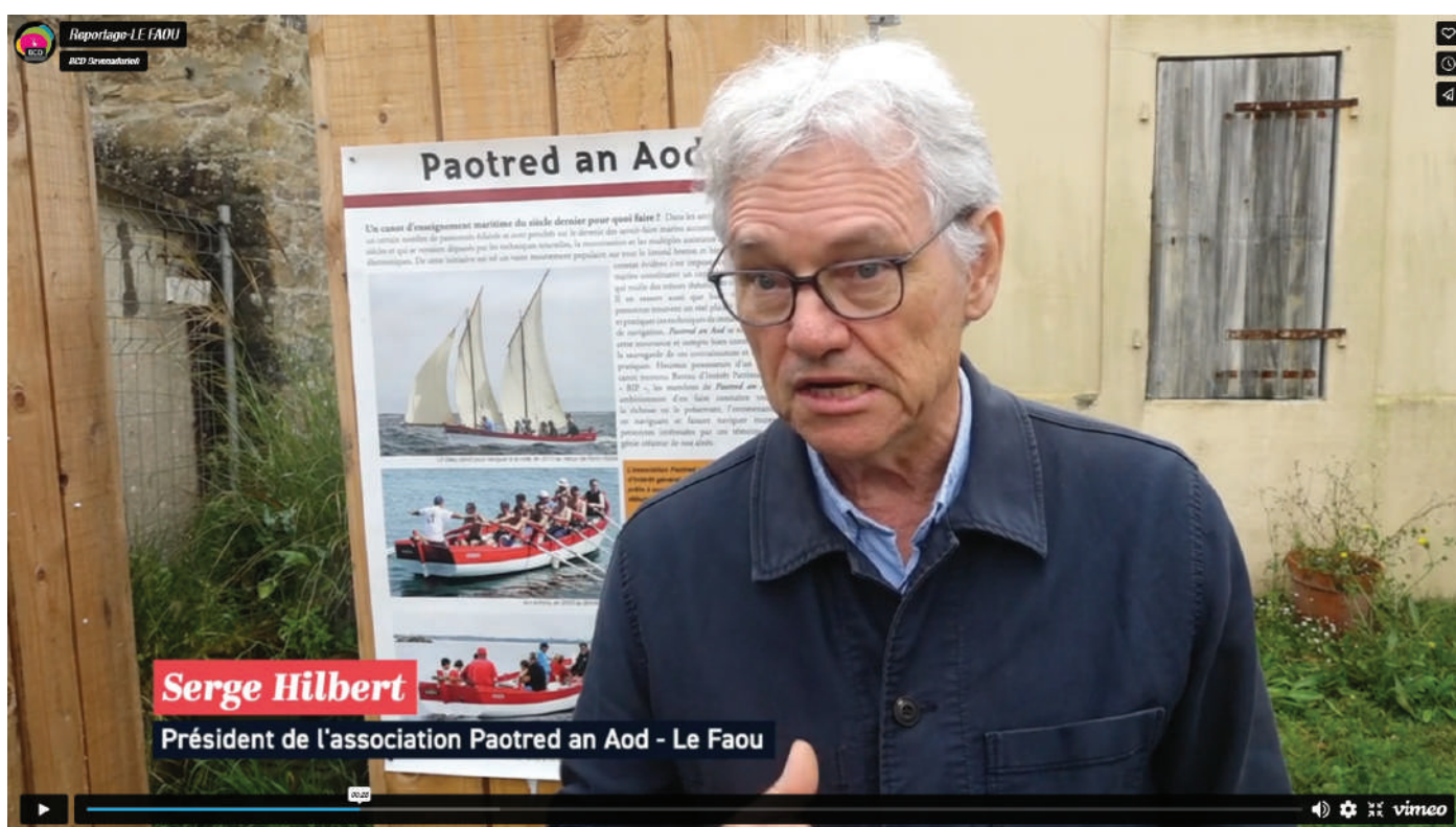
Extrait du reportage filmé par Tébéo. 16.09.2023

Ça vous dit d'embarquer à bord d'un chantier de rénovation d'une chaloupe des années 1960 ? C'est ce que l'association Paotred an Aod proposait comme activité lors des JEP. Jeune matelot ou matelot aguerrri, les participants ont été plongés dans le savoir-faire détenu par les membres de l'association ravis de partager leurs connaissances et leur vécu. Une exposition était également proposée pour en apprendre davantage sur l'histoire de cette fameuse chaloupe et de son sauvetage.