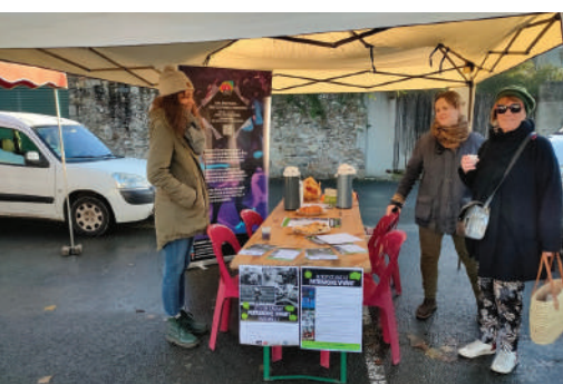
Permanence sur le marché du Faou. 19.11.2022