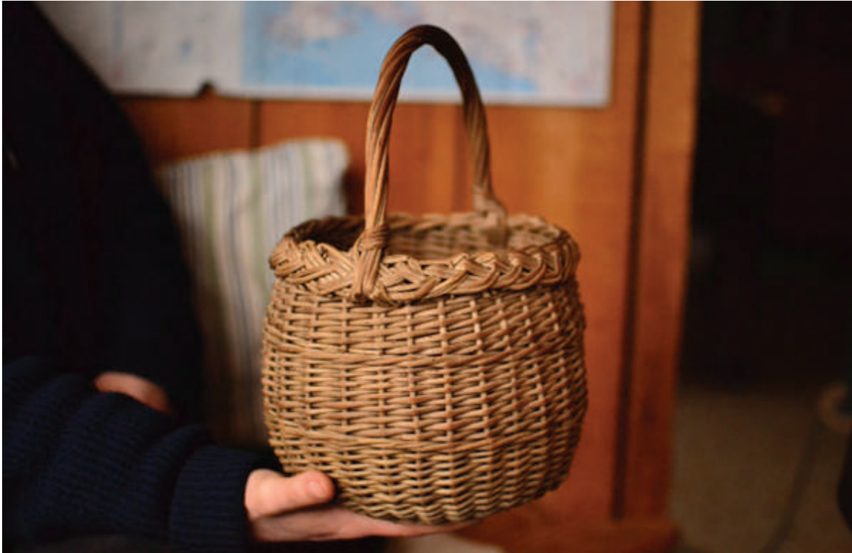
Panier utilisé pour la cueillette des champignons et pour la pêche aux bigorneaux, appartenant à la gérante du bar La Terrasse. 12.03.2023