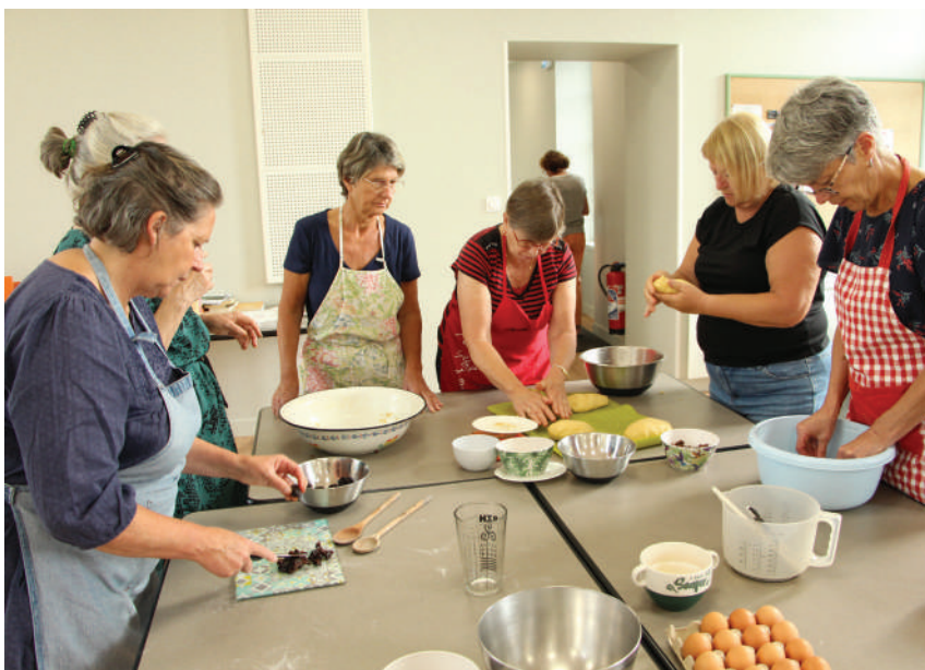
Les participantes à l'atelier pasteo du samedi matin. L'ensemble des ateliers du week-end affichait complet, réunissant au total une trentaine de personnes. 16.09.2023