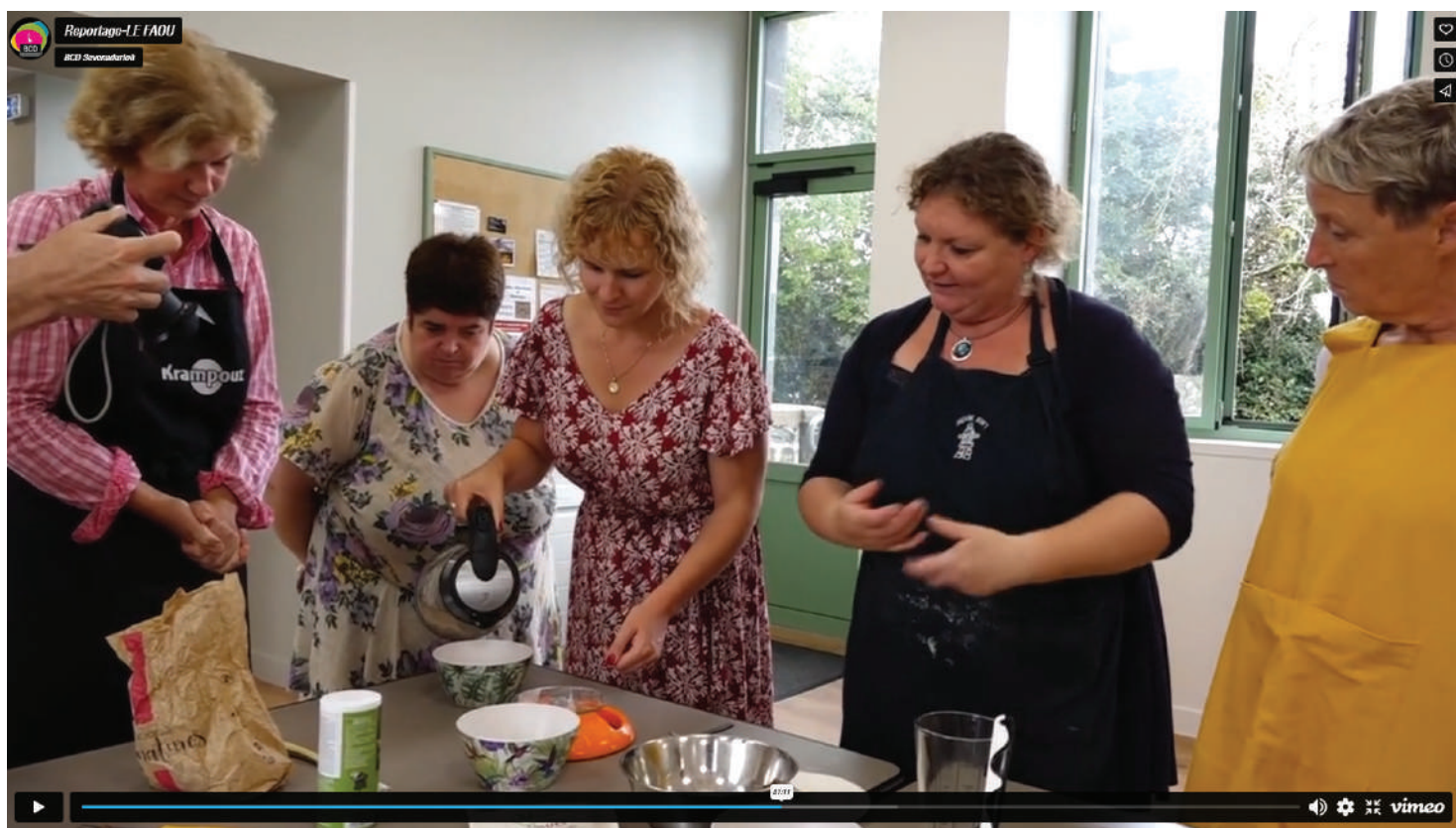
Reportage de Tébéo / Tébésud diffusé le lundi 18 septembre 2023.