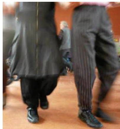
Le patrimoine vivant est mis à l'honneur.

Trois temps d'échange supplémentaires et ouvert à tous sont proposés : une réunion publique, en mairie, ce mercredi 9 novembre, à 18 h, et deux rencontres sur le marché, les samedis 19 et 26 novembre, à partir de 9 h.