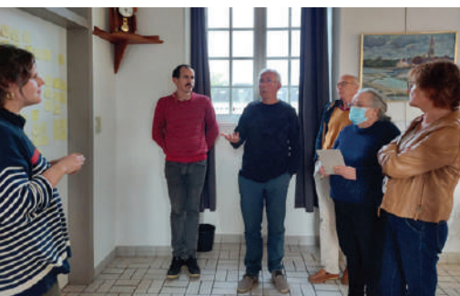
Réunion publique au Faou. Échanges autour de la question : Qu'est-ce que vous évoque le terme « patrimoine » ? - 09.11.2022.

Pour répondre à cette nécessaire implication des personnes, nous avons utilisé différents outils :