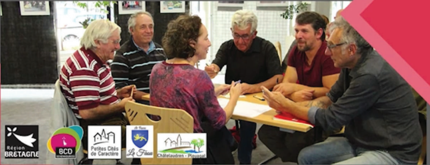
Chronique sur les antennes de Tébéo / Tébésud diffusée le jeudi 9 mars 2023