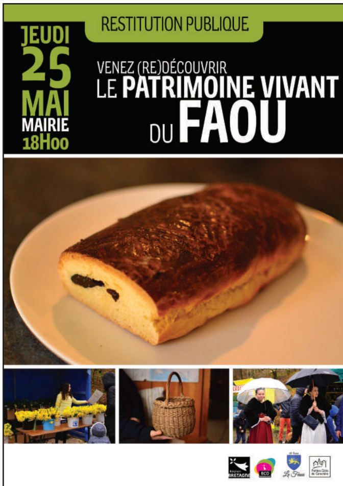
Affiche de la restitution publique au Faou.

Pour cette troisième phase, la communication s'est concentrée sur la restitution publique, une affiche a été conçue afin d'inviter la population à la présentation du bilan du projet.