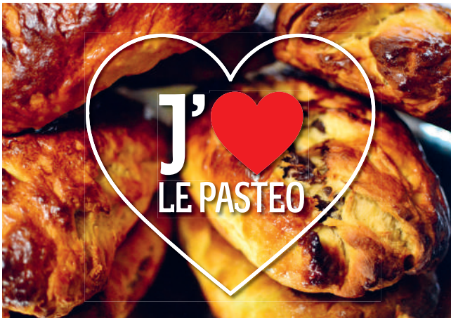
Le recto de la carte postale, illustré par des pasteos.

Par ailleurs, Tébéo est venu filmer un reportage le samedi 16 septembre sur les animations proposées. La vidéo est à retrouver sur le site www.pci.bzh